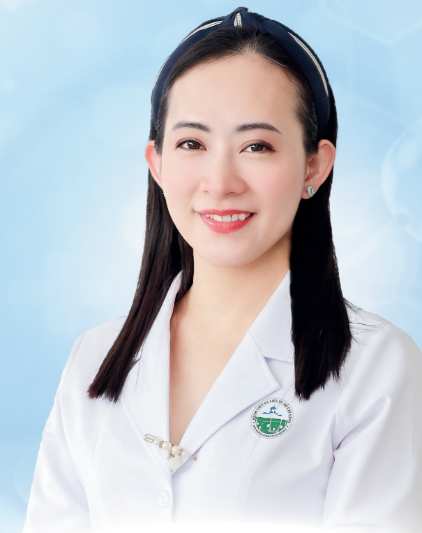
TM. BAN TỔ CHỨC TRƯỞNG BAN