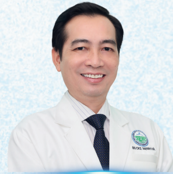
BS. CKII BÙI MẠNH HÀ